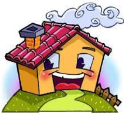
“ Vivi a Ripa”